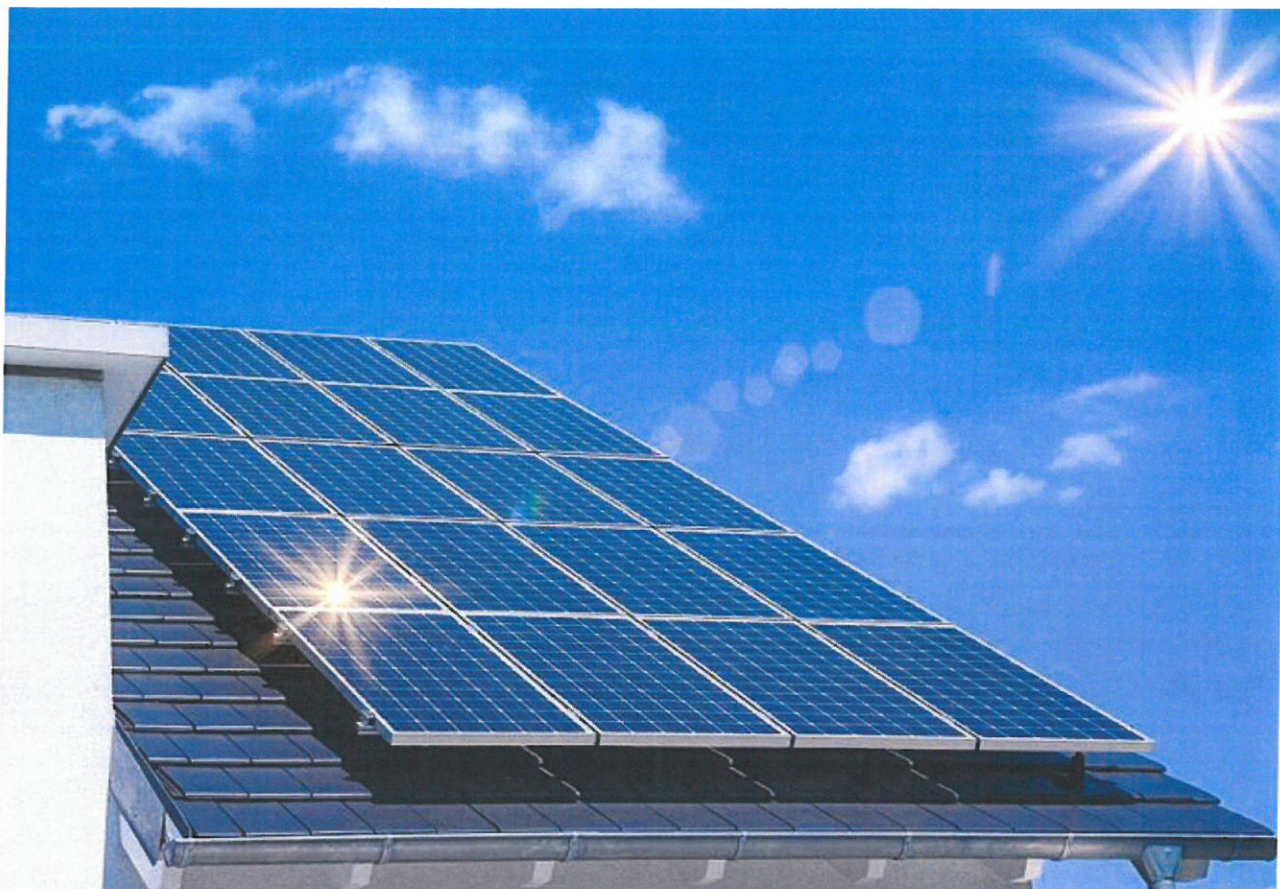
Przykład montażu paneli na dachu skośnym