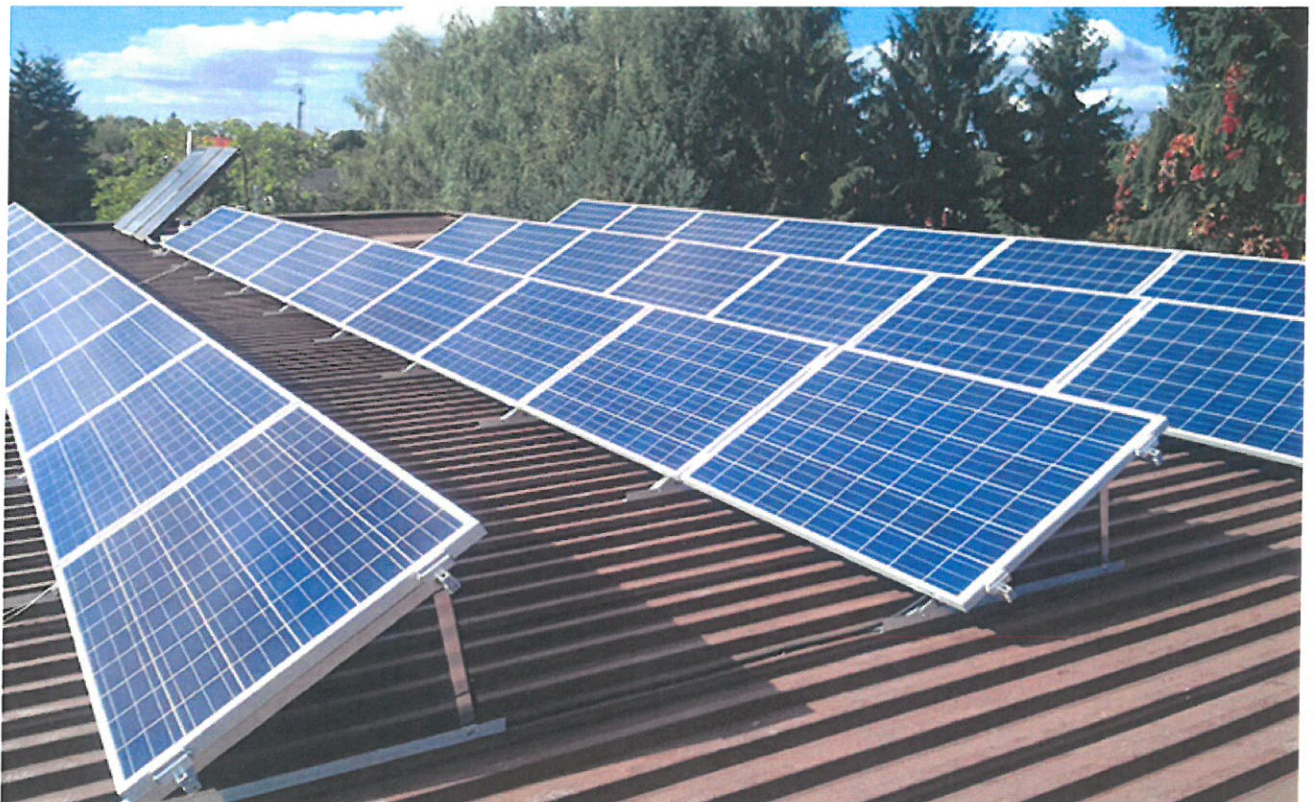
Przykład montażu paneli na dachu płaskim pokrytym blachą trapezową