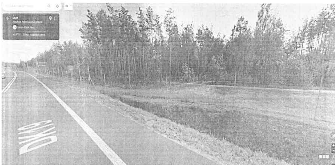
Fotografia okolic ul. Cedrowej wedle stanu z 2012 r. – rok po oddaniu Obw. Wasilkowa do ruchu publicznego.

Wskazany wyżej odcinek „drogi” nie jest drogą, a jest w istocie jedynie „zajeżdżonym pasem terenu” w pasie drogowym będącym w zarządzie GDDKiA.