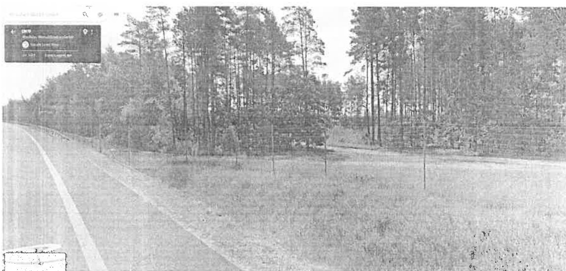
Fotografia okolic ul. Cedrowej wedle stanu z 2023 r.