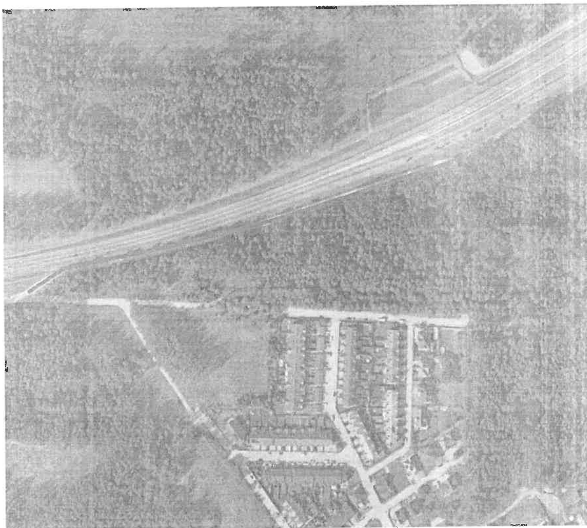
Mapa pomocnicza okolic ul. Cedrowej w Wasilkowie w sąsiedztwie tzw. Osiedla Leśnego.

plan zagospodarowania - w załączeniu) i nie została ówczasnie zrealizowana w terenie, co potwierdzają również archiwalne fotografie terenowe.